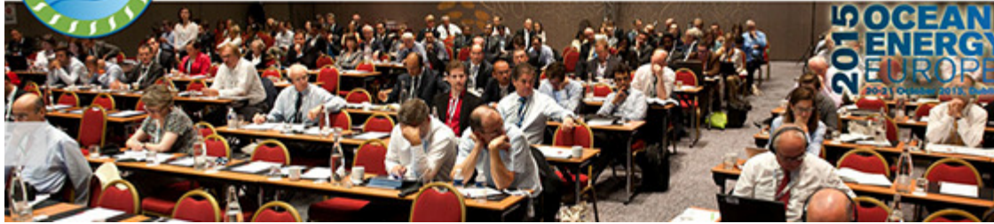
Ocean Energy Europe 2015 (Dublin, Irland)

20-21 oktober äger konferensen och mässan Ocean Energy Europe rum i Dublin. Arrangören beskriver eventet som det tillfälle då flest europeiska ministrar, flest representanter från Europeiska Kommissionen och flest deltagare från industrin är samlade. OffshoreVäst kommer att vara på plats tillsammans med en grupp av medlemmar i en gemensam monter som stöds av Maritima Klustret (VGR), SP och Seaflex.